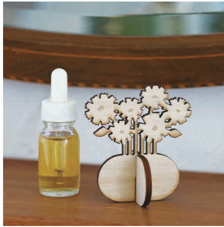
スタンドは自立するのでそのまま飾れて便利。