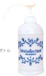
消毒スプレーボトル

消毒用ボトルとして新しく登場しました。磁器の持つ清潔感がアイテムにふさわしく、手指消毒、器具消毒におすすめです。ポンプはアルコール対応で、細かいミスト状の霧を噴霧します。バランスの良いフォームは500ml入るサイズです。