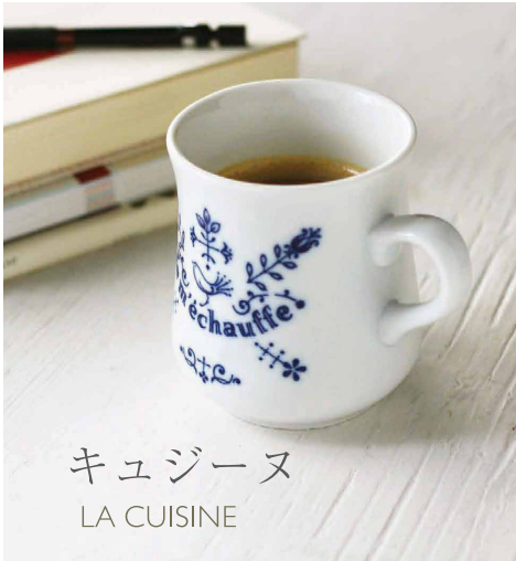
キュジーヌ LA CUISINE