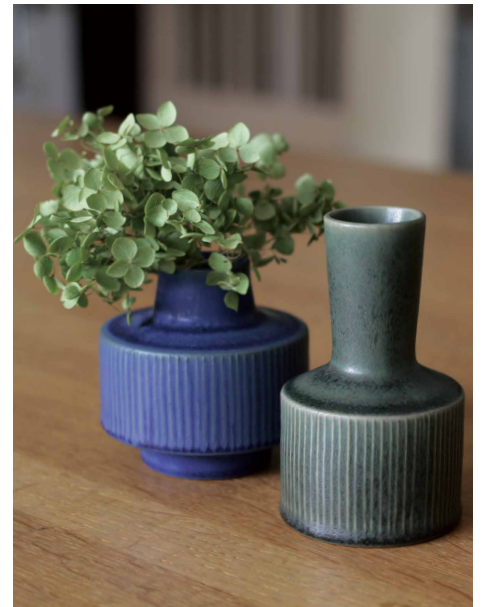
ドライフラワーのシャビーな雰囲気とも好相性。