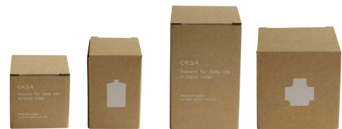
※箱の2面に、文字とそれぞれのイラストを印刷した箱入り。

変化に富んだ釉葉の表情が魅力的な、小さな陶器の花瓶です。小さくて繊細な口縁（こうえん）が特徴的なショートとロングは、野原で摘んだ草花や、庭木や鉢植えから剪定したひと枝を気軽に生けられるミニサイズ。いくつか並べて楽しみたい一輪挿しです。ひと回り大きなシャープ・フラットは、サイドのエンボス模様が釉葉の表情を深め、ピンテージ感漂う仕上げです。