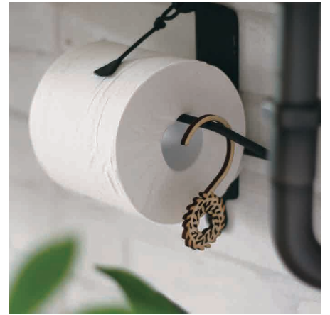
フックはボール、鴨居、ノブなどにひっかけて。

植物や動物の形をレーザーで彫刻した木のアロマ用チップです。お手持ちのアロマオイルなどを塗って染み込ませればディフューザーとして香りを楽しめます。2本セット、組み立て式のスタンドタイプ、ひっかけて使えるフックタイプがあります。