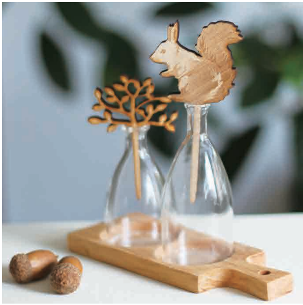
2本セットはミニベースにさしたリトレイにのせて。