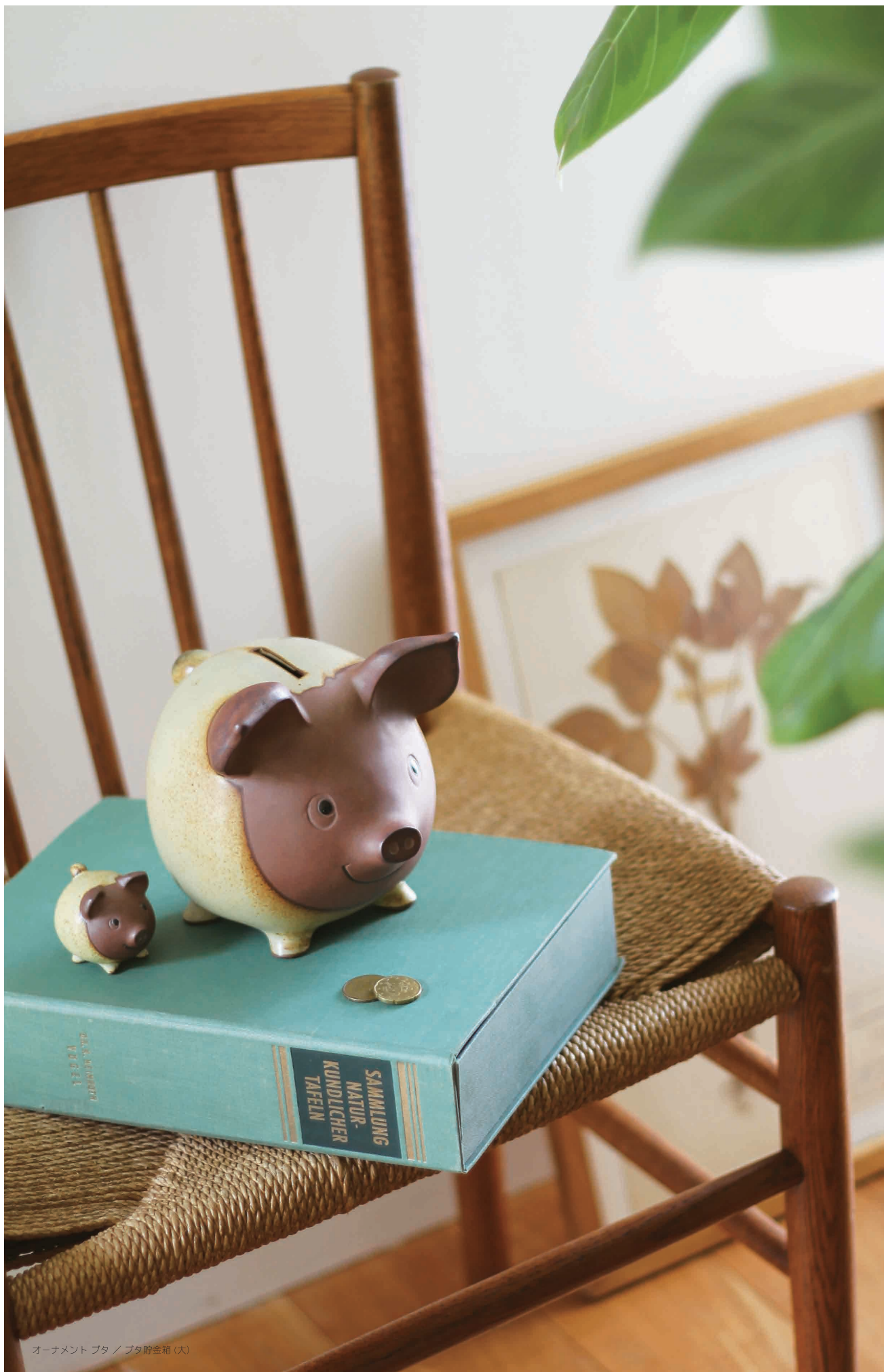
オーナメント 猪 / 猪貯金箱 (大)