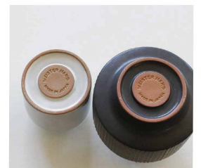
底にロゴが入っています。

※このシリーズは特性上個体差がやすい商品です。P.5-7～商品の特性についてをご確認ください。 3. 色ムラ・質感の差/4. 表情のある土