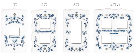
スイッチプレート

インテリア向けにあたたかみのある素地色にこだわったスイッチカバー。お部屋のイメージアップ、アレンジに。1穴から4穴までアイテムも充実。