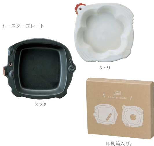
トースタープレート